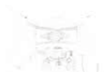
Under The Arch