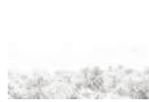
The Prophet's Mosque

First edition March 2017. All artworks by ©Moath Alofi and ©Madani Sindi. Artworks are copyright of the artists and no reproduction is permitted without the express permission of the artists. For information please visit www.madacint.com