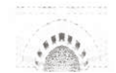
The Prophet's Niche