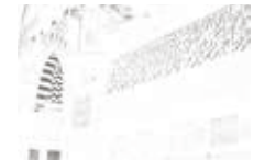
The Southern Wall