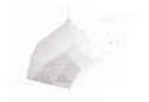
The Green Dome