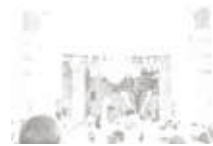
The Passage of Peace